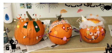
Activité de citrouilles

Sandra St-Laurent, Partenariat communauté en santé tél: 867 668-2663 poste 800, pcsyukon@francosante.ca